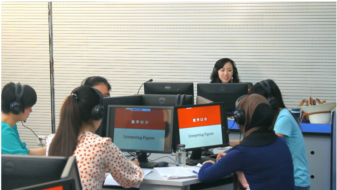
5、同声传译实验室（博世）位于教学六楼二层，1 间共 40 座，译员单元 12 个。