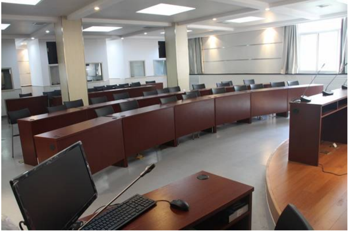
6、计算机辅助翻译实验室 (Trados) 位于教学六楼二层 1 间，42 位，建于 2013 年。