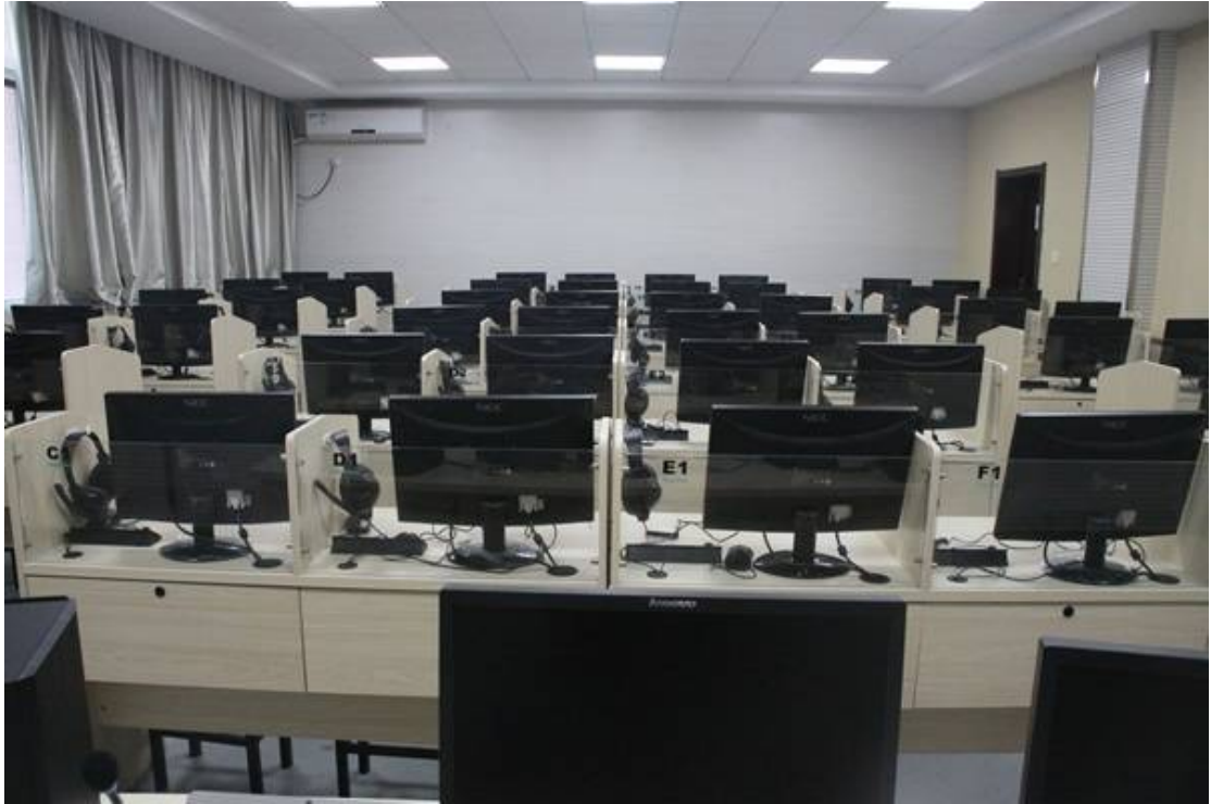
5、凌极数字语言实验室（上海凌极）位于教学六楼三层四间共 208 座，建于 2013 年。