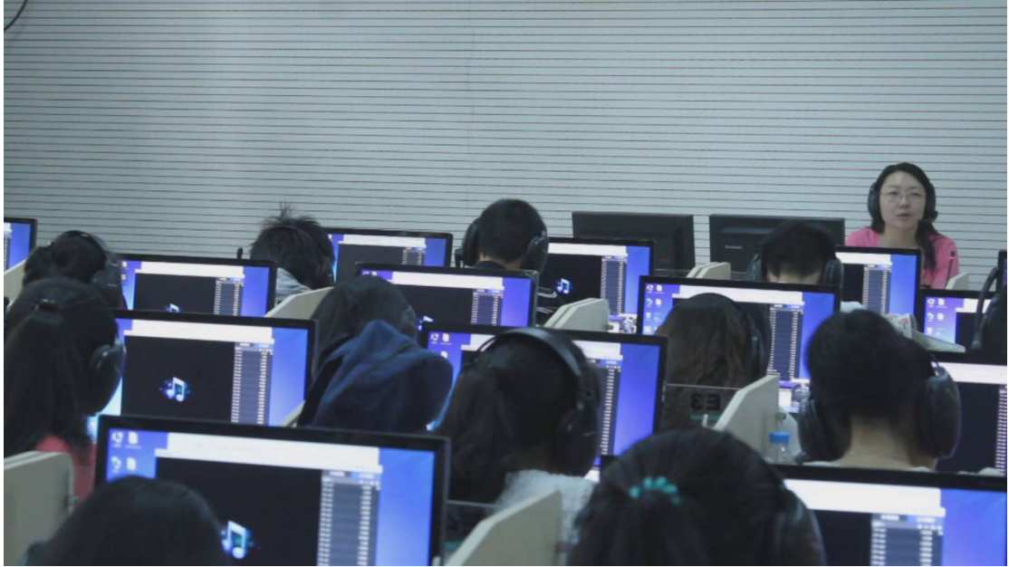
3、New Class DL 970（陕西东方正龙科技信息有限公司）位于逸夫科技楼四层六间共 336 座，2014 年建设。